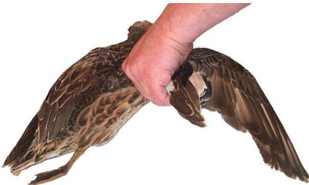
3- Prendre dans la main l'aile droite accompagnée des plumes scapulaires