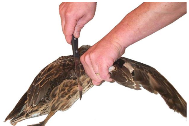
4- Couper l'aile au niveau de l'articulation de l'épaule