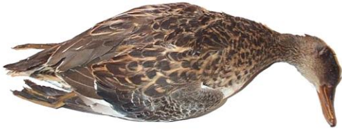
1- Poser l'oiseau sur un plan de travail droit